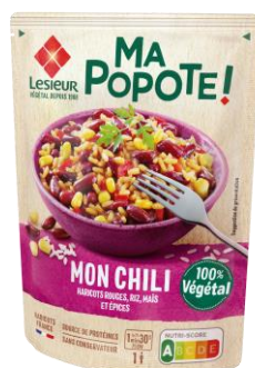
Mes mixes de légumineuses en sachet micro-ondable

(Haricots rouges / Pois chiches) 200g – PMC* 2.79€