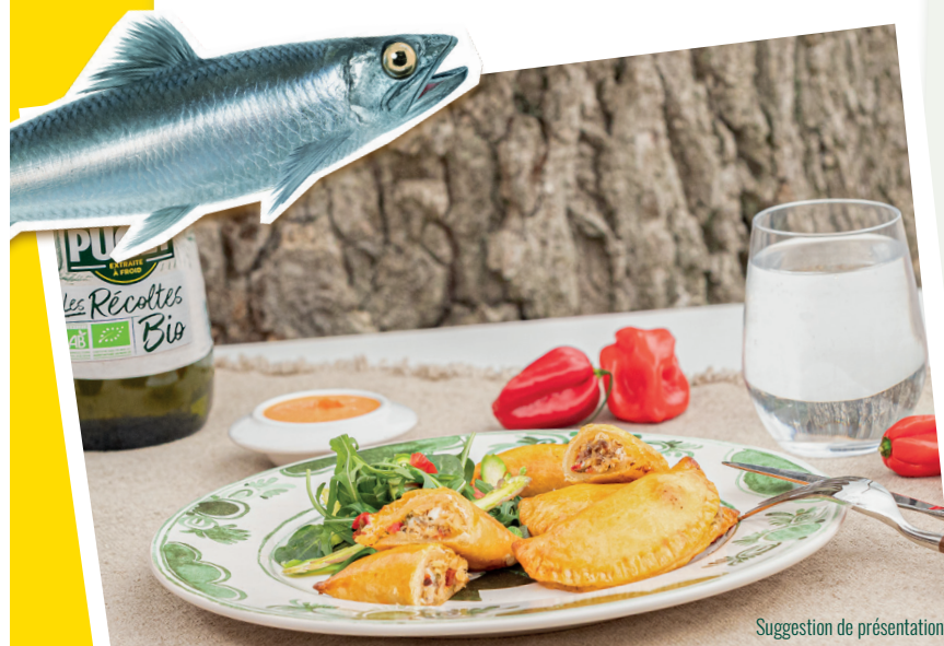
Suggestion de présentation

Accompagnez d'une salade mélangée, assaisonnée d'un filet d'huile d'olive vierge extra Bio PUGET, et d'un trait de vinaigre de xérès.