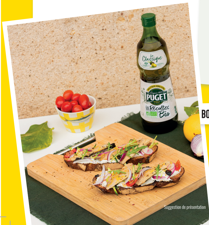
Suggestion de présentation